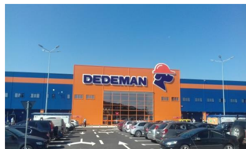
Poza reala santier