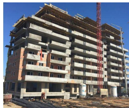
Poza reala santier