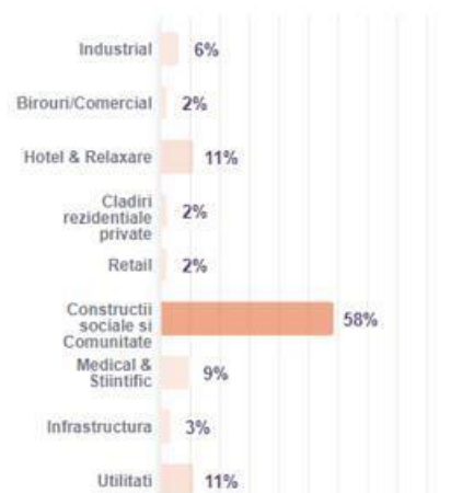
Filtru proiect dupa stadiu